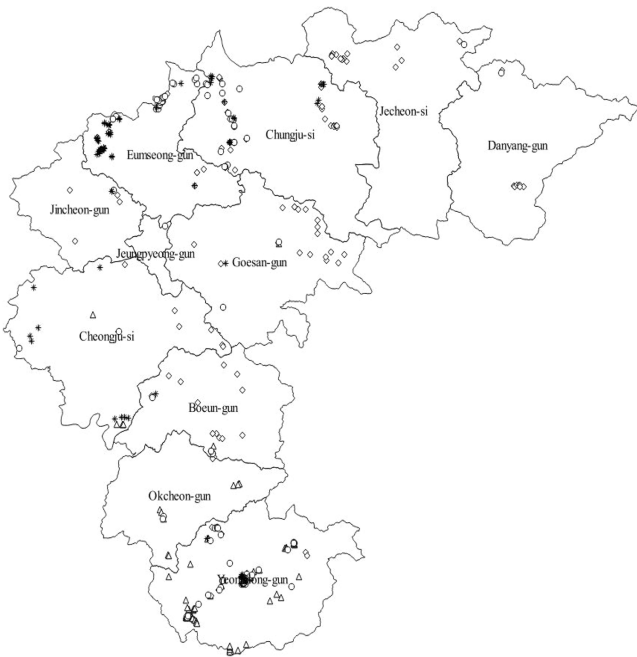
Fig. 1. The location of 387 survey sites in Chungbuk province (◇ : Apple, * : Pear, ○ : Peach, △ : Grape).

빈도는 전체 방형구 수에 대한 특정 종이 출현한 표본의 백분율로, 특정 종이 출현한 조사구 수를 총 조사구 수로 나눈 후 100을 곱한 값이며, 상대빈도(RF)는 특정 종의 빈도를 모든 출현 종의 빈도 총합으로 나눈 값에 100을 곱하여 구하였다. 상대피도(RC)는 특정종의 피도 합을 출현한 모든 종의 피도 총합으로 나눈 후 100을 곱하여 구하였다. 중요치(IV)는 상대빈도와 상대피도의 합을 반으로 나누어