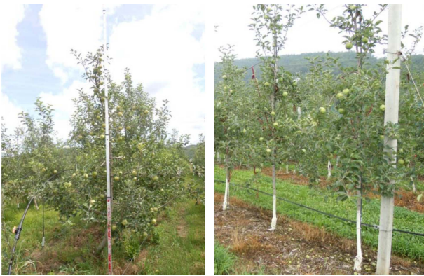
Fig. 2. Scenario of weed control at twice (left hand side) and thrice (right hand side) application of GFA (40DAT) in September, 2011.

초생재배는 자연적으로 자라고 있는 잡초를 제거하지 않고 키우면서 초장이 50 cm 정도 자랐을 때에만 동력예초기를 이용하여 예초하였으며, 기계제초구는 동력예취기(계양, KY-42E, 40.6 cc)를 사용하여 지상부에서 5 cm를 넘지 않도록 지표면에 밀착하여 예초하였으며, 제초제 처리시기에 맞춰 연 3회 실시하였다.