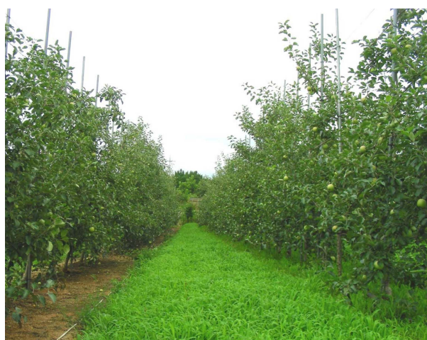
Fig. 1. Weed control treatment in Uisung, 2011.

부직포피복구는 매년 제초제 1차 처리시기에 (주)삼량 A.T.I.에서 생산한 중량 60 g m -2 , 두께 0.4 mm, 폭 100 cm의 검은색 부직포를 사용하여 수관하부에 멀칭용 핀으로 최대한 빈틈이 없도록 피복하였으며, 부직포 틈새를 통해 성장하는 잡초는 손으로 수시 제거해주었다. 과실수확 후에는 부직포를 제거하였고, 초봄에 잡초의 생육이 시작할 때까지 방치한 후 다음해 제초제 처리시기에 맞춰 재 피복하였다.